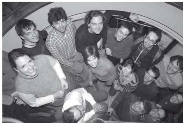
Die Mitglieder der ThuJA – „Thüringer Junge Allgemeinmedizin“.